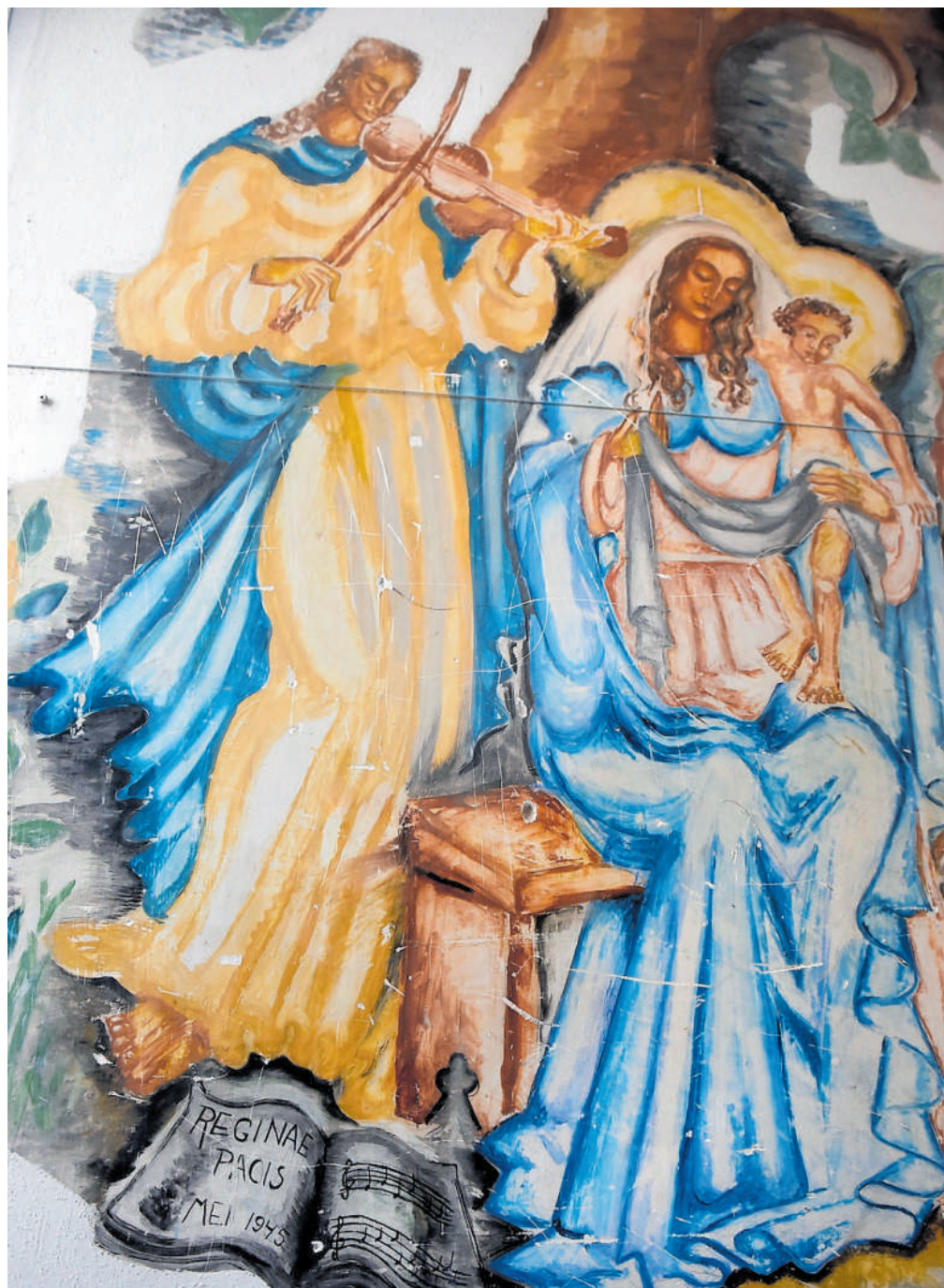
Fragment van Pierre de Grauw's fresco in Witmarsum.

● Erik Dijkstra's boek Strafkamp Yde verschijnt volgend voorjaar. Zie voor meer informatie: www.strafkampyde.hicd.nl